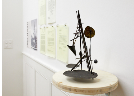
Basis Kunst und Bau I (2017). Modell von Walter Link (1964).

Die Ausstellung untersucht Auswahlverfahren, indem laufende Wettbewerbe und Projektpräsentationen gezeigt werden.