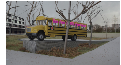
Junger Löwe (2025). Visualisierung mit Model.

9. Kunst & Bau Kt. Bern: Dendriform . Betonunterstand geschalt, gestüppert, gelocht. Anstalten Witzwil, 2010.