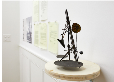
Basis Kunst und Bau I (2017). Modell von Walter Link (1964).

Die Ausstellung untersucht Auswahlverfahren, indem laufende Wettbewerbe und Projektpräsentationen gezeigt werden.