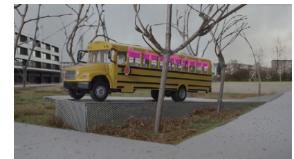
Junger Löwe (2025). Visualisierung mit Model.

9. Kunst & Bau Kt. Bern: Dendriform . Betonunterstand geschalt, gestüppert, gelocht. Anstalten Witzwil, 2010.